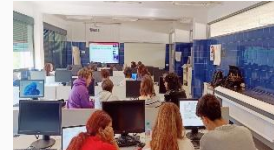
Integrera cirkulärt modeinitiativ i officiella utbildningsprogram

Lär dig mer om varje nationell Ideathon genom att klicka på bilderna