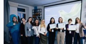
Gemenskapsdrivna cirkulära lösningar och AI-assisterade kapselsamlingar