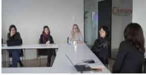
Debatt på hög nivå kring EU:s konkurrenskraft. "Från avfall till värde" cirkulära textilier workshops"