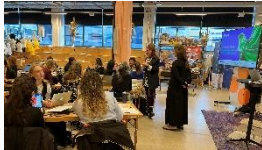
Brainstorming för cirkulär utveckling. Belöningsdrivna hyrsystem och sömmerskenätverk