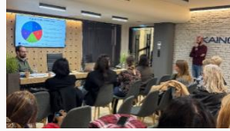
"Fashion Innovation Workshop" med fokus på gröna färdigheter och principer för cirkulär ekonomi