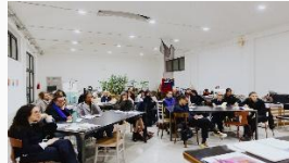
Att ta itu med verkliga affärsutmaningar som ledande kvinnliga entreprenörer innebär